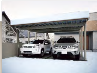
▲ 2 台用