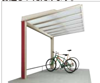
ステンカラー+臙脂色