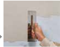
ニューSKプラスターを塗布。