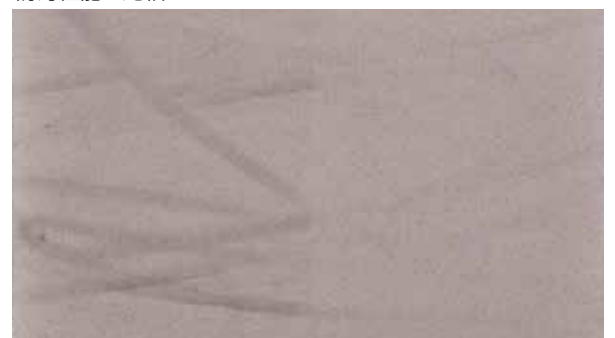
従来のトップコート