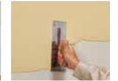
けいそうモダンコート内装、さやか、砂王などの上塗材を塗布。