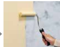
エコ美ウォールをウールローラーで塗布。 (2回または3回塗り) ※2回・3回目は指触乾燥後