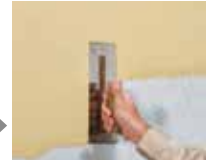
けいそうリフォーム、さやか、ファイシリーズなどのリフォーム対応商品を塗布。