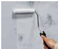
カビ止めシーラーをウールローラーで塗布。

※以下の施工手順は内装用の場合です。 外装用の場合は内装材/外装材/舗装材総合カタログ(P.164)をご覧ください。