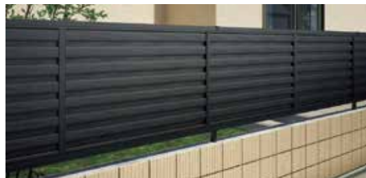
WDY型（ブラックつや消し）