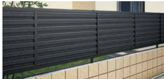
HTY型（ブラックつや消し）