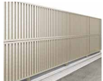
写真は縦ルーバータイプ SQ型（1020サイズ×2）。2段柱仕様。