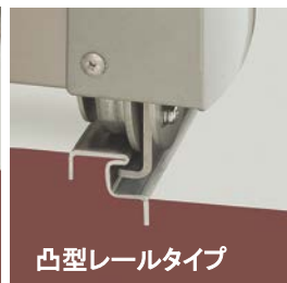
凸型レールタイプ