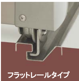
フラットレールタイプ