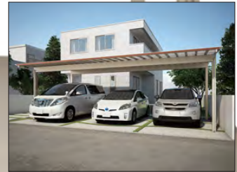
▲ 3 台用