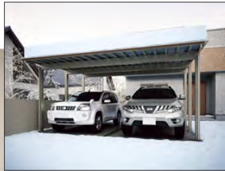
▲ 2 台用