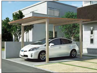
▲ 1 台用