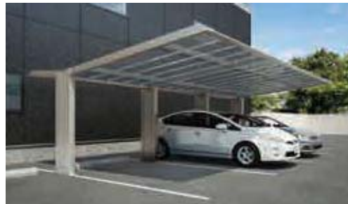
ステンカラー (基本タイプ+連棟ユニット×2)

※積雪量は比重0.3で算出しています。 ※表示の積雪量を超えない内に、必ず雪おろしをしてください。