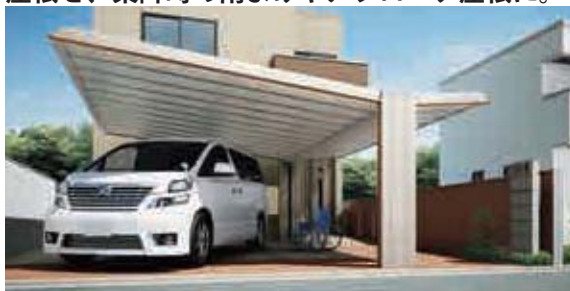
マロンブラウン (ワイドタイプ)