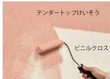
▲ビニルクロスに上塗りOK！