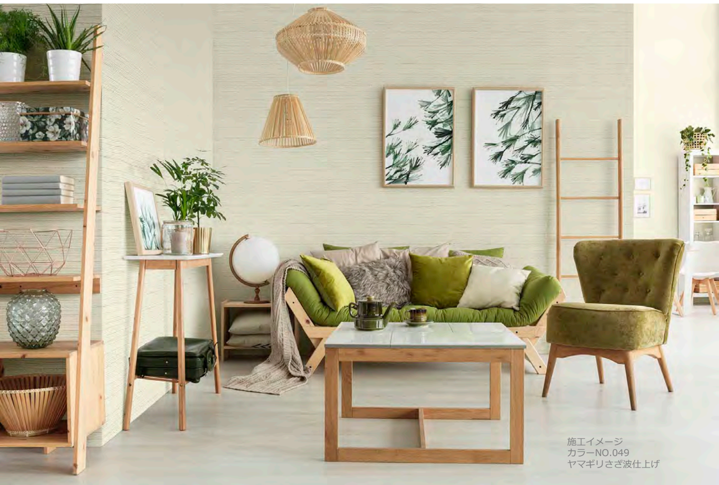
施工イメージ カラーNO.049 ヤマギリさざ波仕上げ