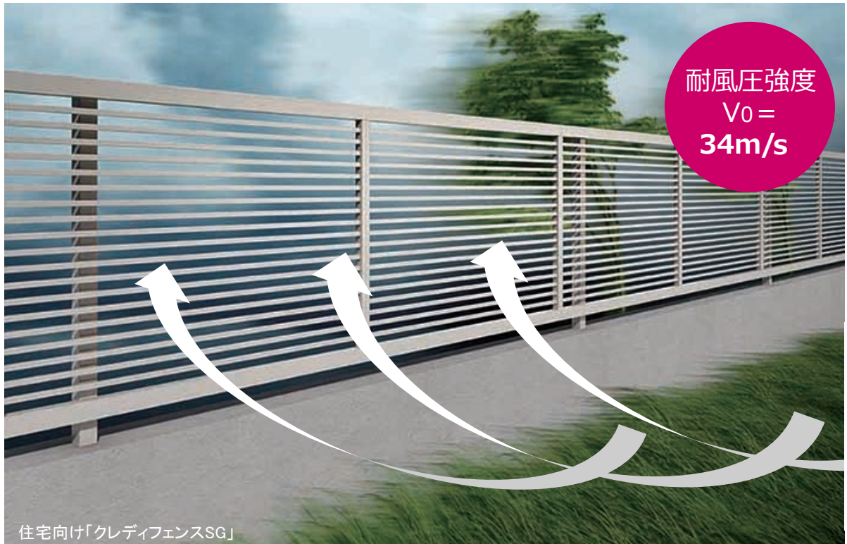
住宅向け「クレディフェンスSG」