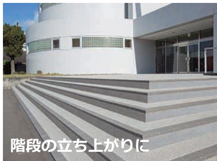
階段の立ち上がり