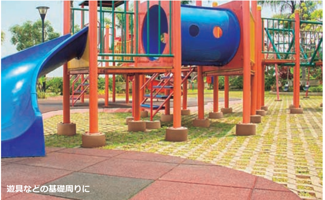
遊具などの基礎周りに