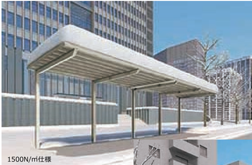
1500N/m 2 仕様