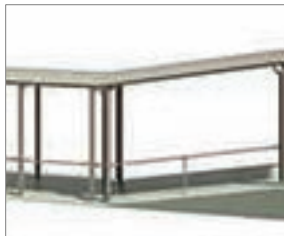
傾斜地対応(Hタイプのみ)