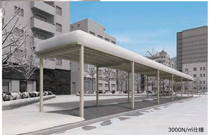
3000N/m 2 仕様