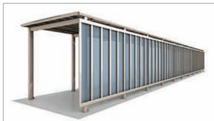
サイドパネル付き