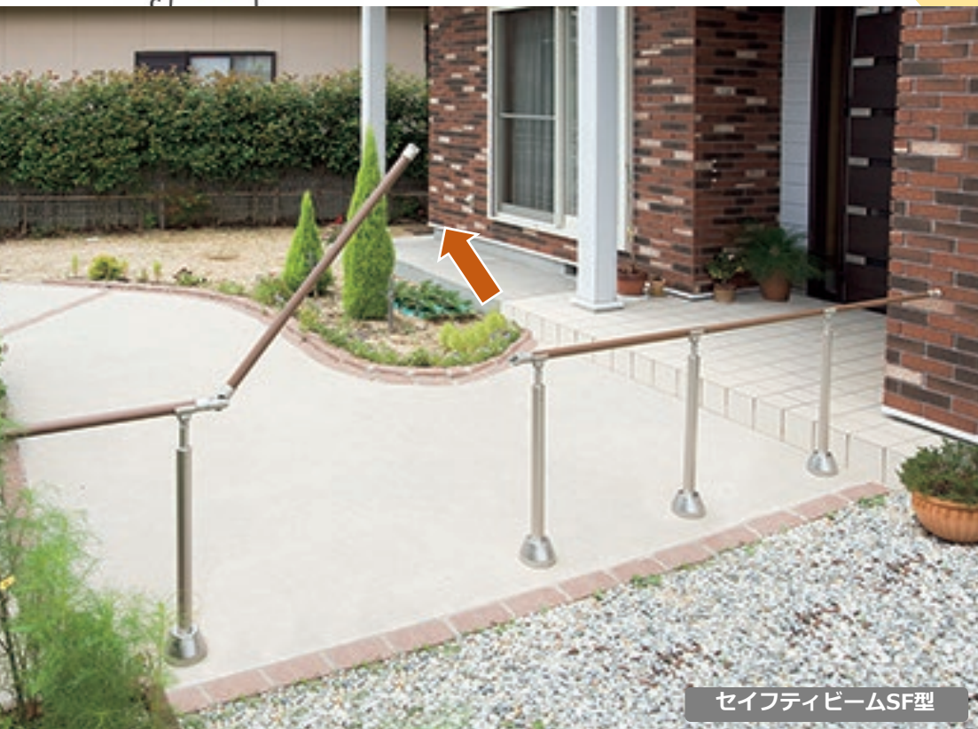
セイフティビームSF型