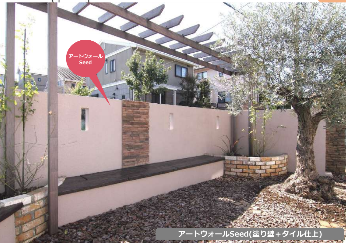
アートウォールSeed(塗り壁+タイル仕上)