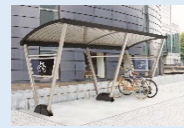
NEO-R : 15.7万円