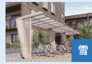
マイルーフ7 : 17.8万円