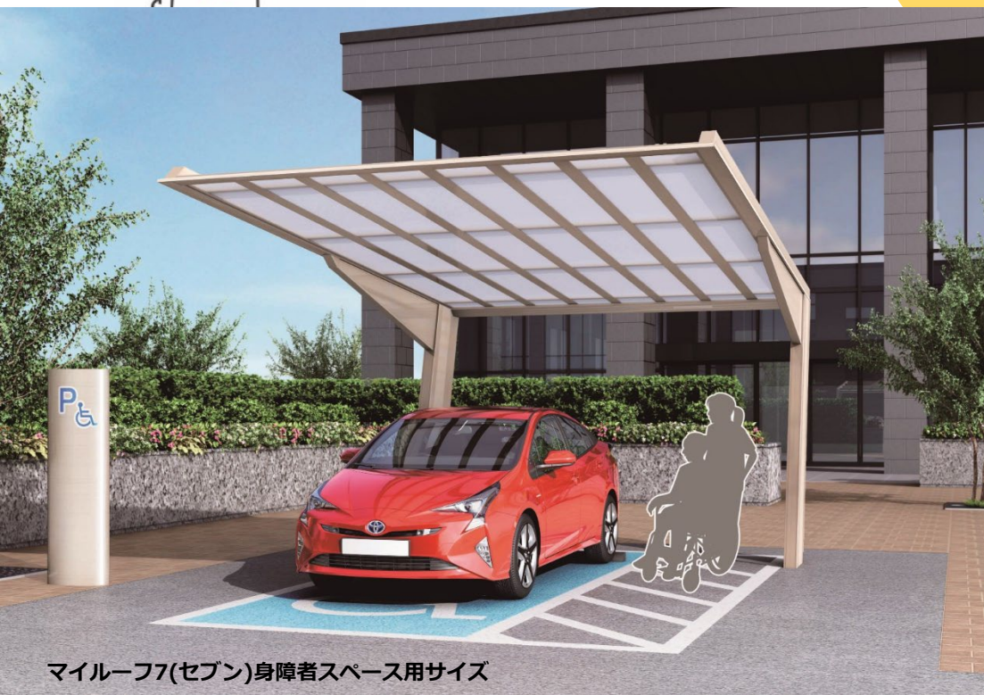
マイルーフ7(セブン)身障者スペース用サイズ

設計者様の声 使いやすさに配慮された形状や 専用のサイズ設定が採用のポイントでした！