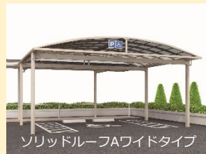
ソリッドルーファワイドタイプ