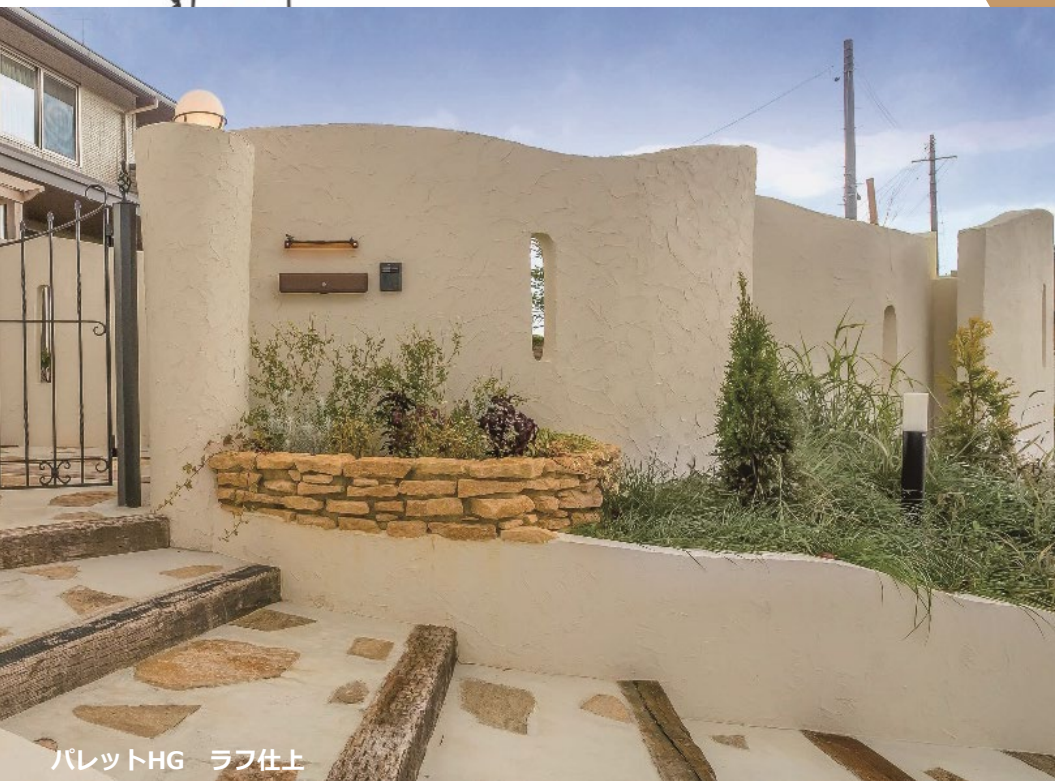
パレットHG ラフ仕上

設計者様の声 幅広い用途で使用できる「パレットHG」に 氷点下でも施工できる仕様が加わり、 季節を問わず使えるようになったね！