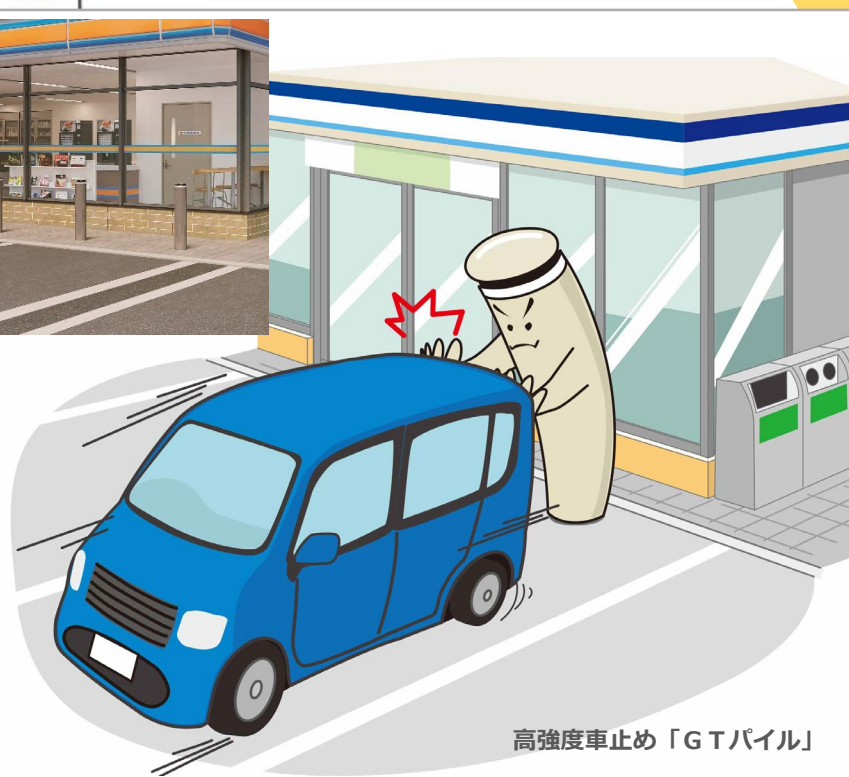
高強度車止め「GTパイル」

店舗オーナー様の声 車の誤発進を考えると、 ガードレールを上回る強度には とても安心感がもてる。