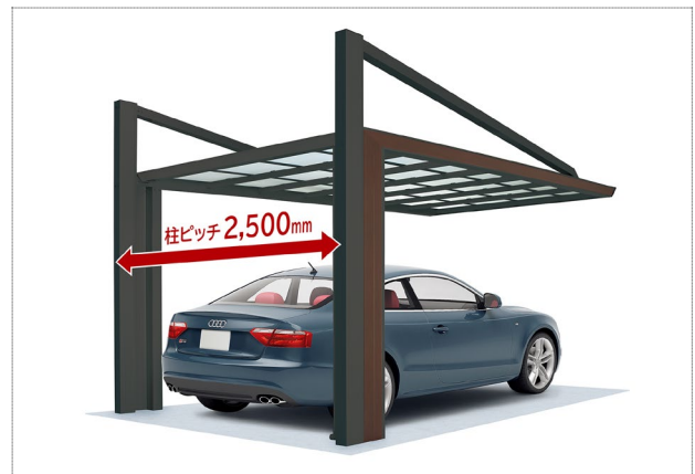
公共用駐車場に最適な柱ピッチ 2,500mm

【レジストルーフ】 積雪荷重3000N/m 2 ・4500N/m 2 対応の高強度アーチウェイです。