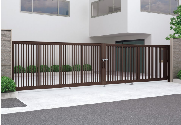
マットブラウン 1,356,000 円（レールタイプ・H20-8W サイズ）