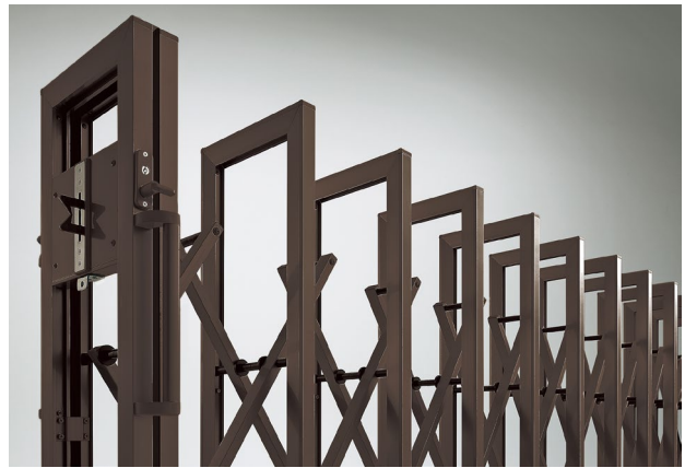
シンプルなスクエアデザインで、さまざまな場所にお使いいただけます。