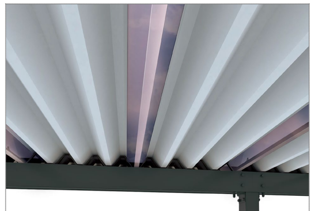
屋根材はポリカ折板と組み合わせることもできます。