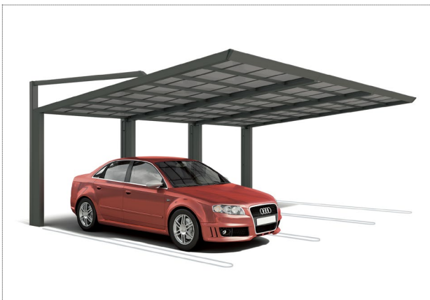
ブラックつや消し 1,525,000円～（熱線遮断ポリカ・3連棟の場合）

【マイルーフ】 側面に柱がないので、車の乗り降りがしやすいストレスフリーなデザインです。