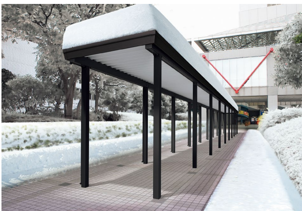
ブラックつや消し m当りの目安価格：105,500円 (3000N/m 2 ・屋根材は含まず)

【レジストルーフ】 積雪荷重3000N/m 2 ・4500N/m 2 対応の高強度アーチウェイです。