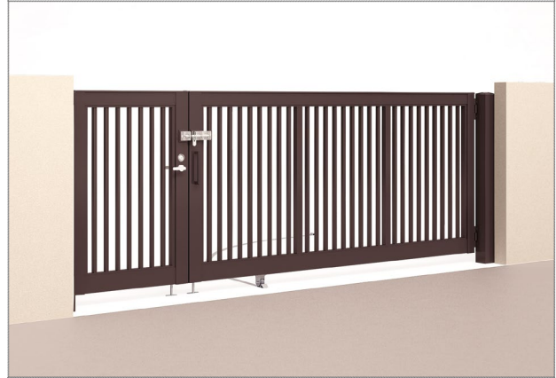
間口の狭い場所に便利な親子開き仕様もあります。

【ATXシリーズ】 レール仕様、キャスター仕様、角地仕様など汎用性の高い大型アコーディオン門扉です。