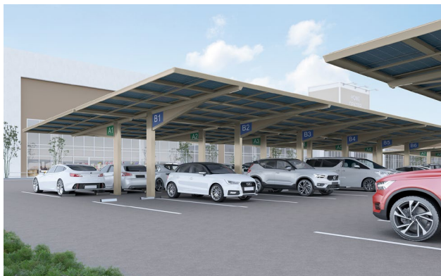
駐車位置が分かりやすい専用サインパネルをご用意。