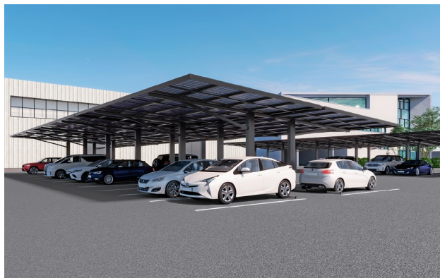
後方支柱でストレスフリーな大規模駐車場を実現。