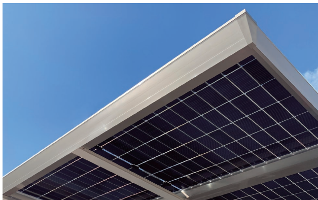
屋根とソーラーパネルを一体化。