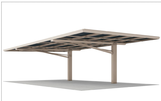
前下がりタイプ (ステンカラー)