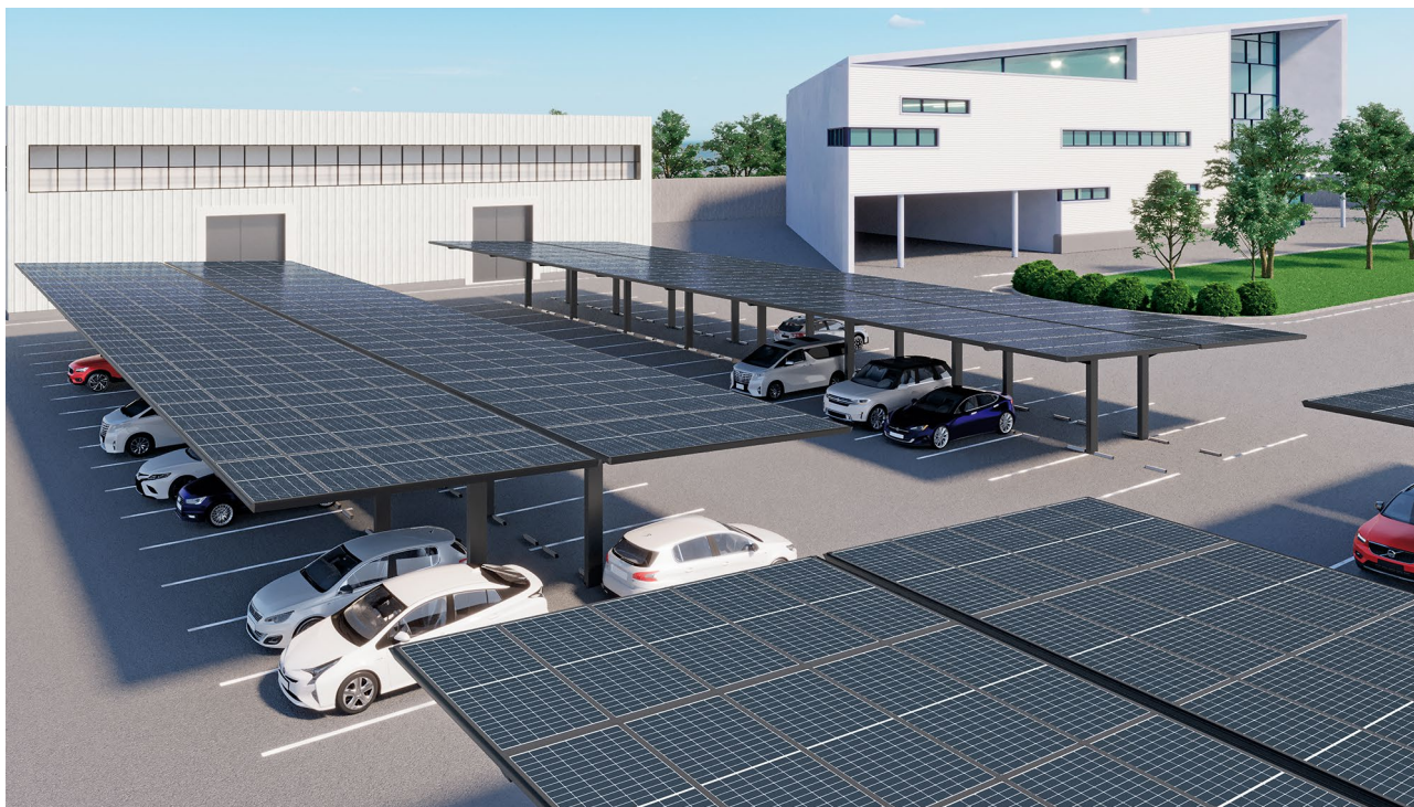
太陽光発電一体型カーポート「ソリスルーフ」(2025年3月発売)

※「MEGLIO (メグリオ)」は、「人と自然に、よりよい巡りを」というコンセプトのもとに生まれた新しいブランドです。