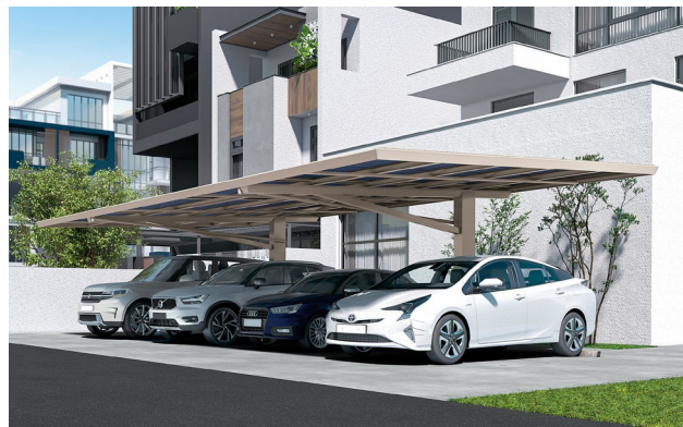
4台駐車分の屋根を柱2本で支える独自の構造。

【サイズ】 間口10,088mm×奥行6,027mm 【カラー】 ブラックつや消し、ステンカラー