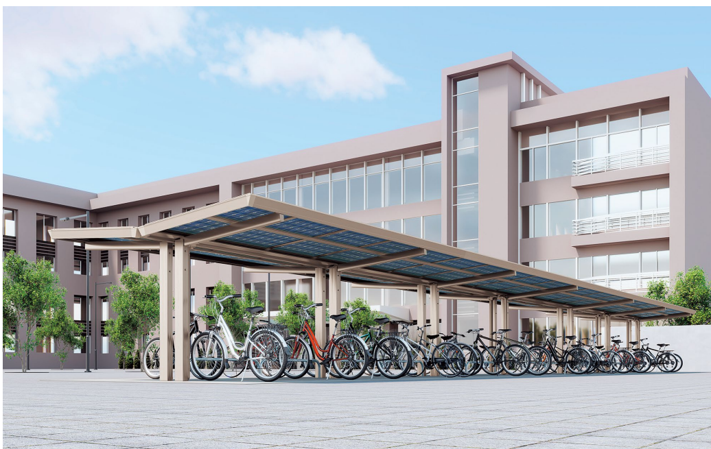
ソリスルーフ駐輪場タイプ

当社では、昨年発売した「駐車場タイプ」や、2026年4月発売の垂直設置型「ソリスパネル」と併せて、発電するエクステリアのトータル提案を推し進めてまいります。