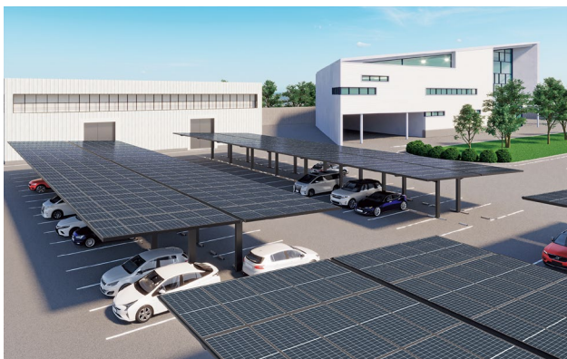
ソリスルーフ駐車場タイプ