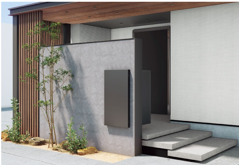
シンプル＆フラットなデザイン

同商品は、モダンな外構によく似合うシンプル＆フラットなデザインが特長です。門袖などの扉に埋め込む仕様で、当社のアルミシステム扉「アートウォール」に取り付けることもできます。クローズ外構向けの「前入れ・後出しタイプ」と「前入れ・前出しタイプ」があり、いずれも電工工事が要らないダイヤル錠式なので、リフォームにも最適です。