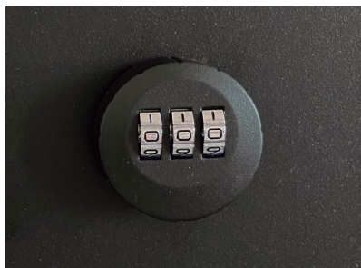
前入れ・後出しタイプのダイヤル錠