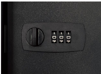
前入れ・前出しタイプのダイヤル錠